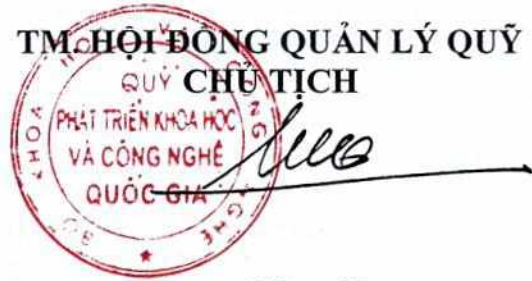
Phạm Công Tạc